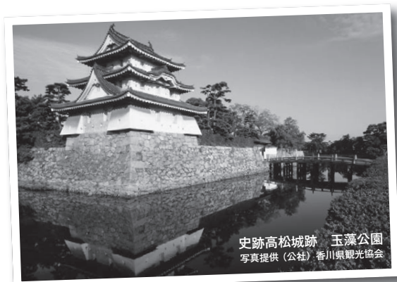
史跡高松城跡 玉藻公園